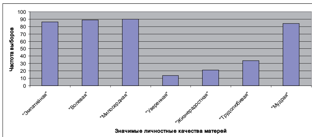
Рис. 1. Значимость личностных качеств для выполнения материнских функций в представлениях современных матерей

шинства матерей знания по этому вопросу либо отсутствуют, либо не являются актуальными.