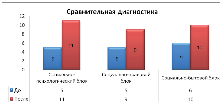
Рис. 2. Сравнительная диагностика уровней (по блокам) до и после эксперимента (составлено авторами)

ческое и графическое моделирование в данной работе. На подготовительном этапе были изучены теоретические аспекты постинтернатного сопровождения детей-сирот и детей, оставшихся без попечения родителей, опыт работы по постинтернатному сопровождению; проведен анализ моделей постинтернатного сопровождения, мониторинг банка данных выпускников; анкетирование с целью сбора и систематизации информации о проблемах выпускников. В процессе организационно-деятельностного этапа была реализована подпрограмма «On`line Клуб Навигатор» программы «Поверь в себя».