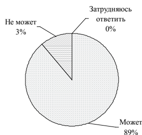
Рис. 4. Ответы на вопрос «Как Вам кажется, может или не может быть высокодуховным неверующий человек?»