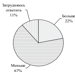
Рис. 1. Ответы на вопрос «Как Вам кажется, сегодня в жизни нашего общества больше или меньше духовности, чем было в советское время?»

Вопрос 3. 67% респондентов (121 человек) из числа преподавательского состава ответили, что сегодня в жизни нашего общества меньше духовности, чем было в советское время, 22% (40 человек) считают обратное и 11% (19 человека) затруднились ответить (рис. 1).