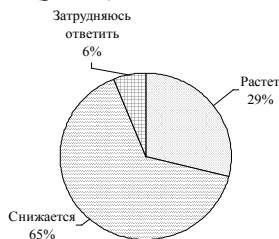
Рис. 2. Ответы на вопрос «Как Вы полагаете, в последние годы уровень духовности в жизни нашего общества растет или снижается?»

Вопрос 4. Мнения разделились следующим образом: 117 преподавателей (65%) ответили, что снижается, 52 преподавателя (29%) – растет, 11 преподавателей (6%) – затруднились ответить (рис. 2).