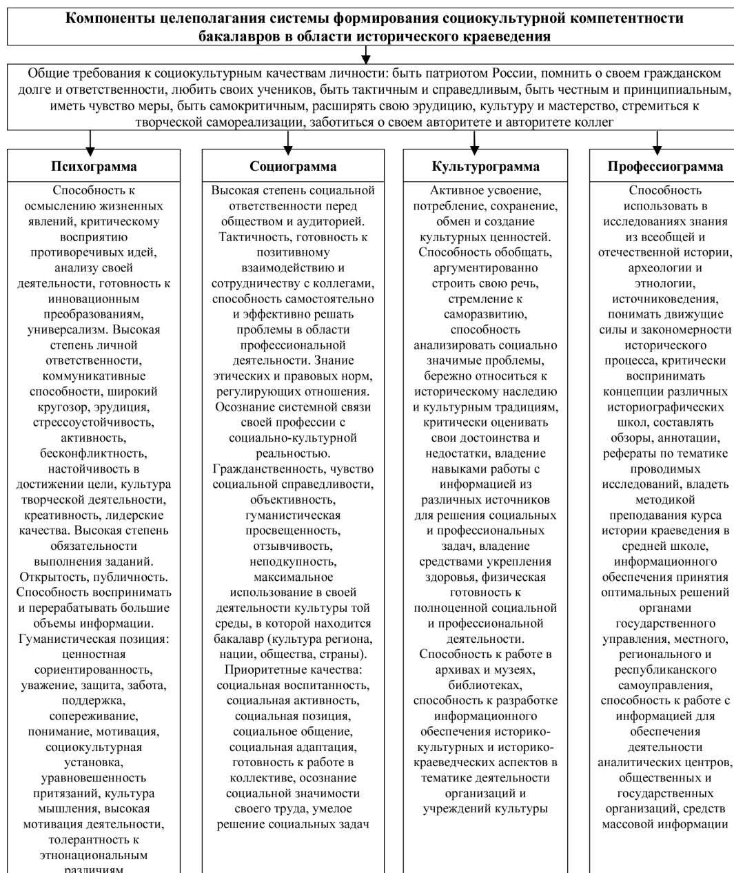
Рис. 2. Цель системы формирования социокультурной компетентности будущих бакалавров по историко-культурному туризму

При определении структуры и содержания социокультурной компетентности классификация компонентов социальной компетентности, данная В.Г. Петвунинским [3], была перенесена на состав социокультурной компетентности студентов. Дадим краткую характери-